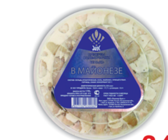
ПРЕСЕРВЫ "СЕЛЬДЬ", майонез, Буй, 170г