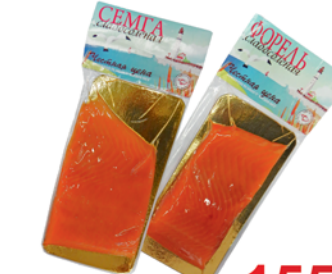
СЕМГА; ФОРЕЛЬ "Честная цена", филе кусок, слабосол., 200г