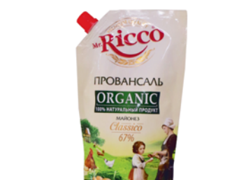
МАЙОНЕЗ "MR.RICCO", Провансаль, ж.67%, 400мл