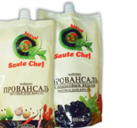
МАЙОНЕЗ "САУТ ШЕФ", Провансаль; Оливковый, ж.67%, 400мл