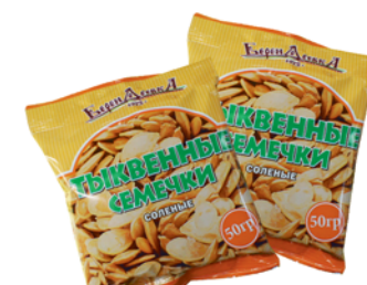
СЕМЕЧКИ "БЕРЕНДЕЕВКА", тыквенные, соленые, 50г