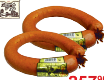
КОЛБАСА "КРАКОВСКАЯ", "Пикантная", Мясной двор, 1кг