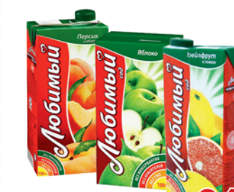
*НЕКТАР "ЛЮБИМЫЙ САД", грейпфрут; яблоко/персик; яблоко, 0.95л