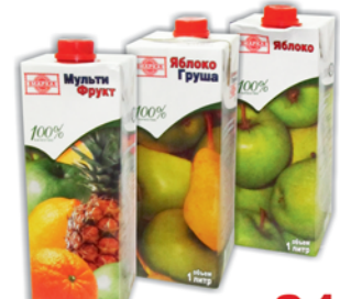
*НЕКТАР "СОЮЗНАЯ МАРКА", мультифрукт; яблоко; яблоко-груша, 1л