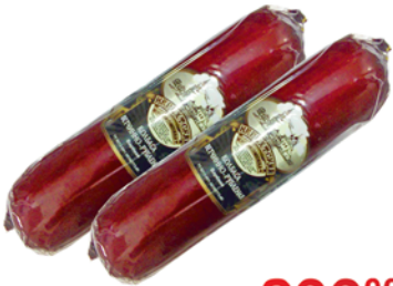
КОЛБАСА "Ветчинно-рубленая", Знатные колбасы, 1кг