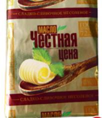
*МАСЛО СЛИВОЧНОЕ "Честная цена", ГОСТ, ж.72,5%, 180г