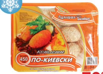
КОТЛЕТЫ "ПО-КИЕВСКИ", со слив. маслом, Адмирал Бенбой, 450г