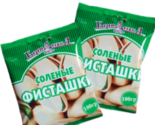
ФИСТАШКИ "БЕРЕНДЕЕВКА", соленые, 100г