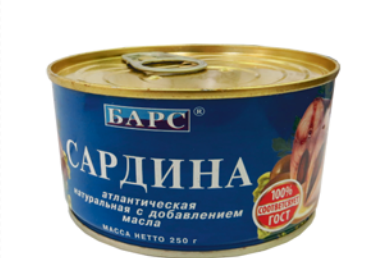
САРИНА АТЛАНТ. "БАРС", с д/м, ж/б, 250г