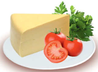
СЫР "ГОЛЛАНДСКИЙ", ж.45%, 1кг