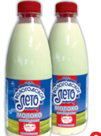
МОЛОКО "Вологодское лето", отборное, ж.3.4-4%, 0,93л