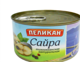
САЙРА "СЕЛЕСТА", "Пеликан", атл/нат, ж/б, 240г