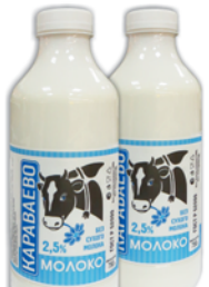
МОЛОКО "КАРАВАЕВО", ж.2.5%, 750г