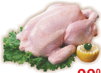
ЦЫПЛЕНОК, охл., 1кг