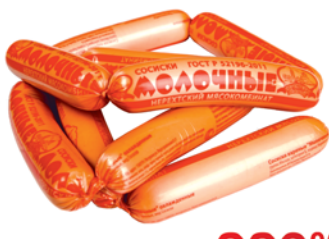
СОСИСКИ "МОЛОЧНЫЕ", ГОСТ, Знатные колбасы, 1кг