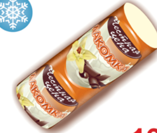
*МОРОЖЕНОЕ "ЧЕСТНАЯ ЦЕНА", "Лакомка", 90г