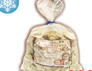
ПЕЛЬМЕНИ "САМОЛЕТНЫЕ", 1кг