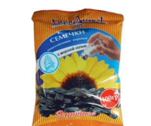
СЕМЕЧКИ "БЕРЕНДЕЕВКА", Элитные, жар., с мор. солью, 100г