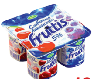
*ЙОГУРТ "ФРУТТИС", вишня/черника, ж.5%, 115г