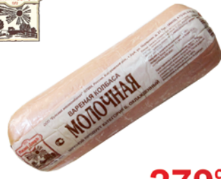
*КОЛБАСА "МОЛОЧНАЯ", 1с, Мясной двор, 1кг