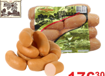
ШПИКАЧКИ "ДАНИЛОВСКИЕ", Мясной двор, 1кг