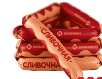
СОСИСКИ "СЛИВОЧНЫЕ", Останкино, 1кг