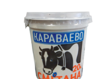
СМЕТАНА "КАРАВАЕВО", ж.20%, 330г