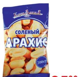
АРАХИС "БЕРЕНДЕЕВКА", соленый, 200г