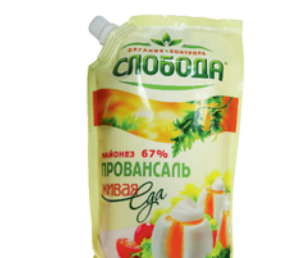
МАЙОНЕЗ "СЛОБОДА", Провансаль, ж.67%, 400мл