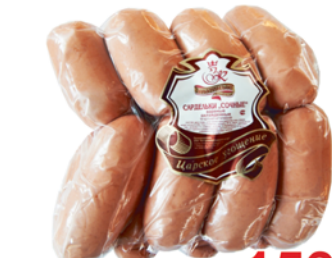
*САРДЕЛЬКИ "СОЧНЫЕ", Знатные колбасы, 1кг