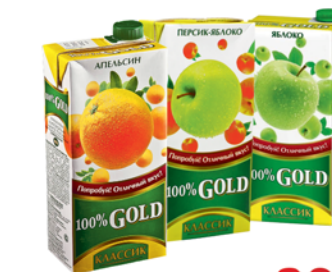
*НАПИТОК "ГОЛД" "КЛАССИК", персик/яблоко; Нектар "Голд", апельсин; Сок "Голд", яблоко, 0.95л