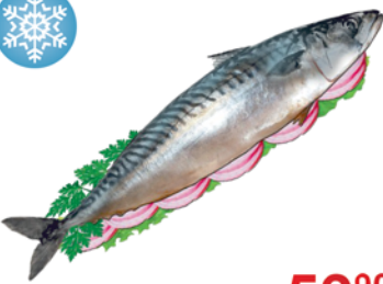
СКУМБРИЯ С/М, 1кг