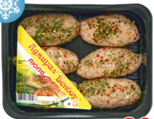
ЛЮЛЯ КУРИНЫЕ, Адмирал Бенбой, 450г