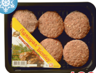
БИФТЕКС С ЧЕСНОКОМ, Адмирал Бенбой, 450г