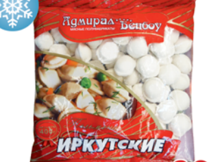
ПЕЛЬМЕНИ "ИРКУТСКИЕ", Адмирал Бенбой, 400г