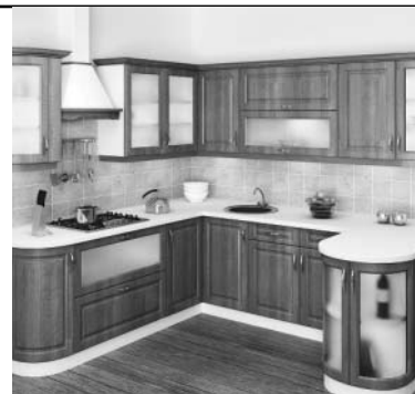
При заказе кухни встроенная вытяжка в подарок!**

- Для оформления рассрочки необходимо обратиться в офис ООО «Вавилон» и заполнить анкету. Причем нет необходимости приносить с собой справку о доходах, достаточно паспорта.