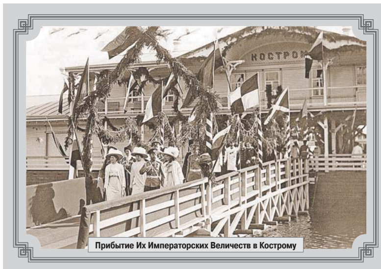
Прибытие Их Императорских Величеств в Кострому

Центром событий второго дня стало посещение Николаем II Костромского кремля и закладка памятника к 300-летию Дома Романовых. Сама идея памятника