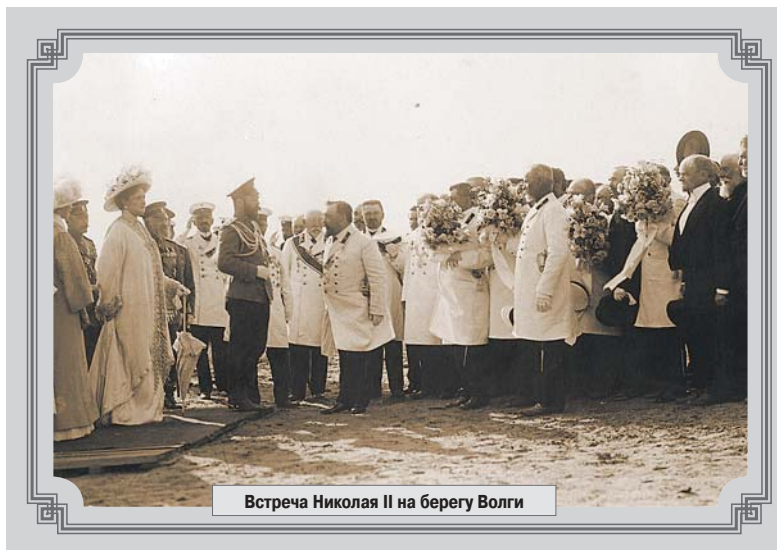
Встреча Николая II на берегу Волги