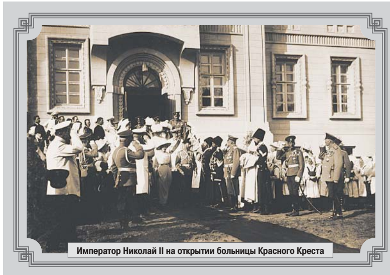
Император Николай II на открытии больницы Красного Креста