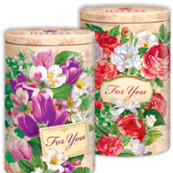
ЧАЙ "ХЕЙЛИС", "Букет", 90г