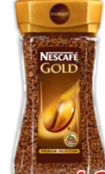
КОФЕ "НЕСКАФЕ", "Голд", ст/б, 95г