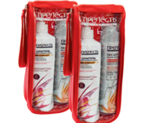
*НАБОР "ПРЕЛЕСТЬ PROFESSIONAL", Абсолютный блеск, лак+шампунь+косметичка