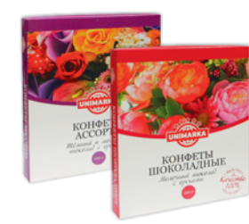
*НАБОР КОНФЕТ "ЮНИМАРКА", темн. и молоч.ш. с орех., молоч. ш. с орех., 120г