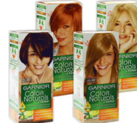
*КРАСКА ДЛЯ ВОЛОС "COLOR NATURALS", Garnier, в ассорт.