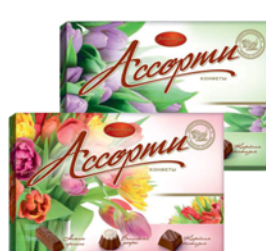
КОНФЕТЫ "АССОРТИ", Волшебница, в ассорт., 200г