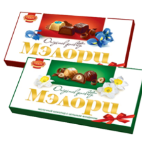
КОНФЕТЫ "МЭЛОРИ", Глобус, 190г