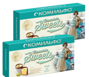
*КОНФЕТЫ "КОМИФО", фисташка, 116г