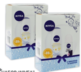
*НАБОР "NIVEA", "Роскошное прикосновение" ж/н., гель д/д+дез. антиперс. защита д/чер и бел.