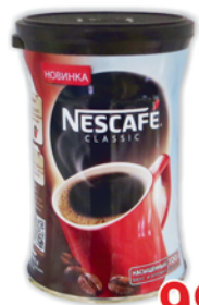
КОФЕ "НЕСКАФЕ", "Классик", ж/б, 100г