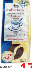
КОФЕ "АРАБИКА", натур., жар., молотый, для завар. в чашке, 200г