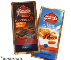
*ШОКОЛАД "ЩЕДРАЯ ДУША", "Очень молочный", с миндалем и вафлей, 95г; "Российский", темный, 90г