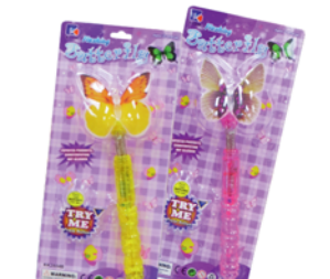
*ИГРУШКА "Палочка светящаяся бабочка"