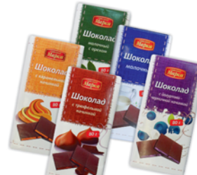
*ШОКОЛАД "СОЮЗНАЯ МАРКА", в ассорт., Зеленоград, 80г