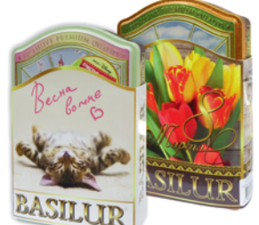
ЧАЙ "BASILUR", Окна, ж/б, 100г