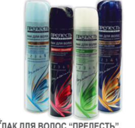
*ЛАК ДЛЯ ВОЛОС "ПРЕЛЕСТЬ", "PROFESSIONAL", Объем; Эффект памяти; Чистый стайлинг; Кератинолечение, 300мл