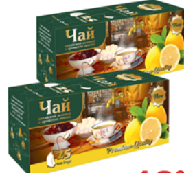
*ЧАЙ ЗЕЛЕНЫЙ БАЙХОВЫЙ, с аром. лимона, 25пак*1.8г