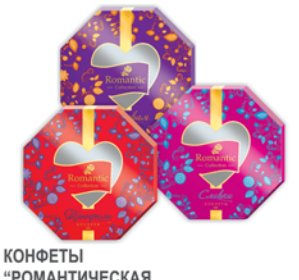
КОНФЕТЫ "РОМАТИЧЕСКАЯ КОЛЛЕКЦИЯ", 200г