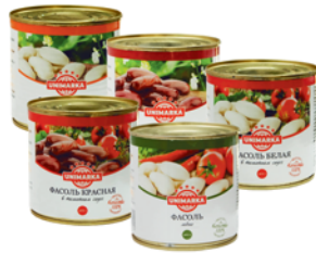
*ФАСОЛЬ "ЮНИМАРКА", красн. натур.; бел. натур.; красн. в том. соусе; бел. в том. соусе; лобин, ж/б, 400г