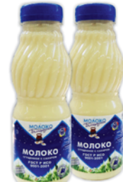
МОЛОКО СГУЩЕННОЕ "БЕЛГОРОДСКОЕ", л/б, 500г