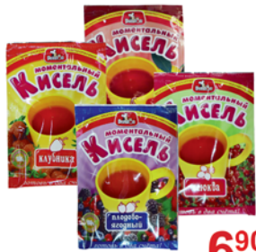
КИСЕЛЬ "ПРЕСТОН", в ассорт., 30г