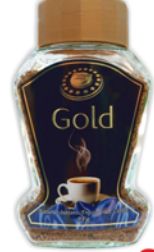
КОФЕ "ВЫСШАЯ ЛИГА", "Gold", натур., раствор., сублим., ст/б, 95г