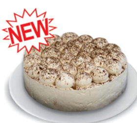
ТОРТ "ТИРАМИСУ", Парус, 800г