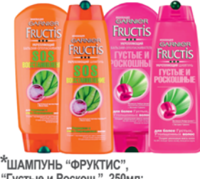
*ШАМПУНЬ "ФРУКТИС", "Густые и Роскош.", 250мл; "SOS Восстанов.", 200мл; Бальз.-ополаск. "Фруктис"; "Густые и Роскошные"; "SOS Восстановление", 200мл