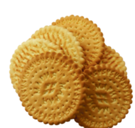
ПЕЧЕНЬЕ "МАРИЯ", затяжное, 1кг