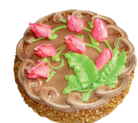
ТОРТ "ВЕСЕННИЙ", Парус, 900г