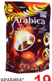
КОФЕ "АРАБИКА", натур., растворимый, м/уп, 250г