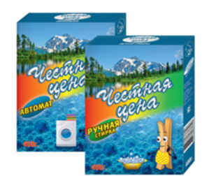
ПОРОШОК СТИРАЛЬНЫЙ "ЧЕСТНАЯ ЦЕНА", автомат; ручная стирка, 400г