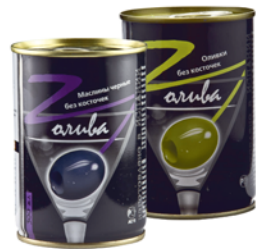
МАСЛИНЫ; ОЛИВКИ "Z-OLIVA", б/к, 300мл