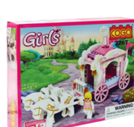
*КОНСТРУКТОР "СОГО", для девочки, арт. 3267