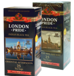
*ЧАЙ "ЛОНДОН ПРАЙД", "Английский завтрак"; "Восточный полдень", 25пак*2г