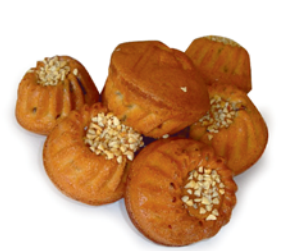
ПИРОЖНОЕ "ДОМАШНЕЕ", Парус, 1кг