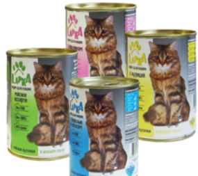
*КОРМ ДЛЯ КОШЕК "ЛАПКА", в ассорт., ж/б, 415г