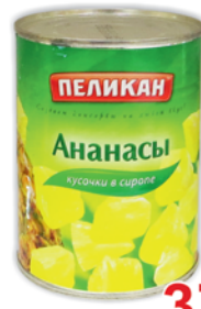
АНАНАСЫ "ПЕЛИКАН", кусочки в сиропе, 565г