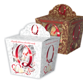
*КОНФЕТЫ "Q", 150г