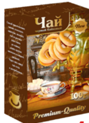
*ЧАЙ ЧЕРНЫЙ БАЙХОВЫЙ, 100г