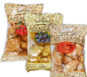
КРУАСАНЫ "БЕРЕНДЕЕВКА", с нач.: черн.; виш.; клуб.; вар. сгущенка; шоколад, 334г