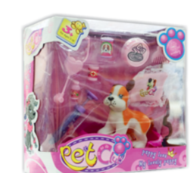
*ИГРУШКА "НАБОР ВЕТЕРИНАРА", в ассорт.