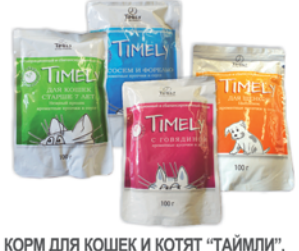
КОРМ ДЛЯ КОШЕК И КОТЯТ "ТАЙМЛИ", ягненок; нежн. телятина; говяд.; крол.; лосось с фор.; Корм д/щенков "Таймли", цыпл., м/уп, 100г