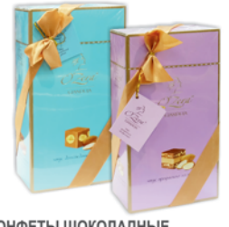
*КОНФЕТЫ ШОКОЛАДНЫЕ "Q ZERA", "Вкус прекрасного настроения"; "Вкус долгожданной удачи", 175г