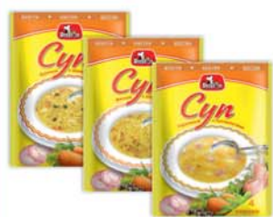
*СУП Б/П "ПРЕСТОН", гороховый с колбасными; куриный с вермишелью; мясной с вермишелью, 60г 750 руб. 1170 руб.