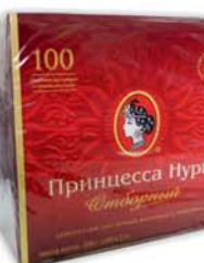
*ЧАЙ "ПРИНЦЕССА НУРИ", "Отборный", черный, 100пак*2г 7390 руб. 9290 руб.