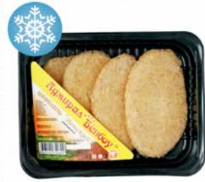
*ШНИЦЕЛЬ "ВЕНСКИЙ", Адмирал Бенбой, 400г