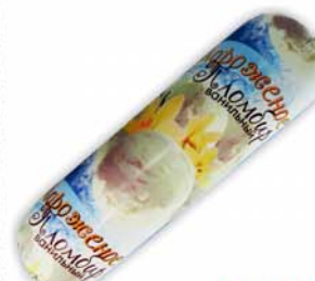
МОРОЖЕНОЕ "БЕРЕДДЕВКА", пломбир, ванильный, 800г