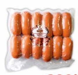
ШПИКАЧКИ "ПО-ВЕНСКИ", Знатные колбасы, 1кг