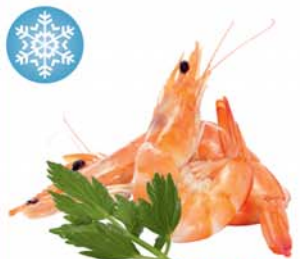
КРЕВЕТКИ "КОРОЛЕВСКИЕ", весовые, 1кг