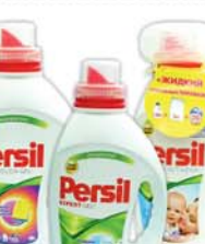
*ТЕЛЬ Д/СТИРКИ "ПЕРСИЛ" "ЭКСПЕРТ", колор; сенсигв; вернел, 1.46л 25900 руб. 46090 руб.