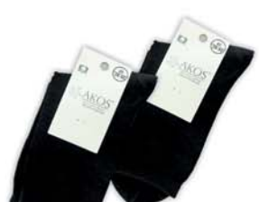
*НОСКИ МУЖСКИЕ C2 A54, черные, p.25, 27, 29 4900 руб. 8190 руб.