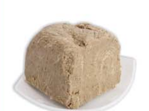
ХАЛВА "1001 НОЧЬ", подсолнечная, 1кг 4990 руб. 6990 руб.