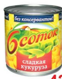
*КУКУРУЗА "Б СОТОК", ж/б, 340г 4290 руб. 6290 руб.