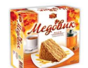
ТОРТ "МЕДОВИК", Москва, 630г 14990 руб. 22590 руб.