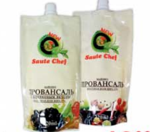
*МАЙОНЕЗ "САУТ ШЕФ", провансаль; оливковый, ж.67%, 220мл