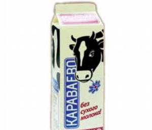
*МОЛОКО "КАРАВАЕВО", отборное, ж.3.4-6%, 930г