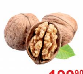
ГРЕЦКИЙ ОРЕХ, неочищенный, 1кг