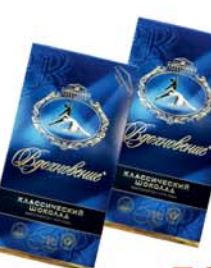
*ШОКОЛАД "ВДОХНОВЕНИЕ", Бабаево, 100г 5990 руб. 7640 руб.