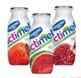
НАПИТОК КИСЛОМОЛОЧНЫЙ "АКТИМЕЛ", в асорт., 100г