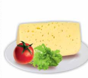
СЫР "РОССИЙСКИЙ", ж.50%, 1кг