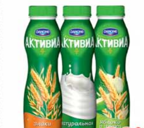
ЙОГУРТ "АКТИВИА", питьевой, в асорт., 290г