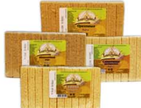
*ВАФЛИ "БЕРЕНДЕЕВКА", шоколад; орех.; сливочн.; с вар. сгущенкой, 220г 2990 руб. 3590 руб.