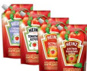
*КЕТЧУП "ХАЙНЦ", томатный; острый; с чесноком и пряностями; для шашлыка и гриля, 350г 4290 руб. 5770 руб.