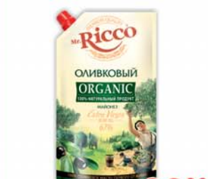
*МАЙОНЕЗ "Mr.RICCO", «Оливковый», ж.67%, 400мл