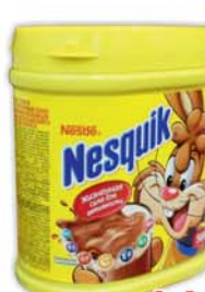
*КАКАО "НЕСКВИК", 500г 11990 руб. 16640 руб.