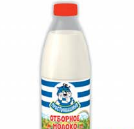
МОЛОКО "ПРОСТОКВАШИНО", отборное, ж.3.4-6%, 930мл