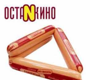
*СОСИКИ "ГОВЯЖЬИ", Останкино, 1кг