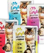
КОРМ Д/КОШЕК "ЛАПКА", в ассорт., м/уп, 100г 1290 руб. 1590 руб.