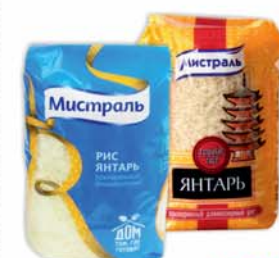
*РИС "МИСТРАЛЬ", "Янтарь", пропаренный, длиннозерный, 900г