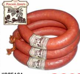
КОЛБАСА "КРАКОВСКАЯ" "Пикантная", п/к, Мясной Двор, 1кг