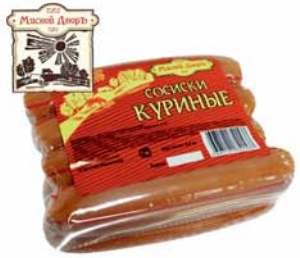
СОСИКИ "КУРИНЫЕ", Мясной двор, 400г