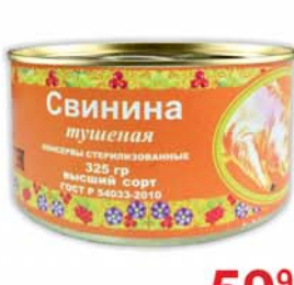
СВИНИНА ТУШЕНАЯ ГОСТ, ж/б, Селятино, 325г