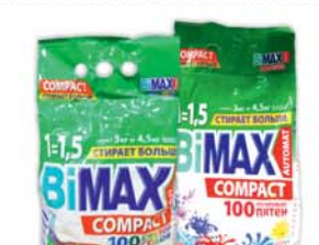
*СТИРАЛЬНЫЙ ПОРОШОК "БИМАКС", автомат, 100 пятен; макс колор, 3кг 21990 руб. 35490 руб.