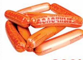
СОСИКИ "МОЛОЧНЫЕ", ГОСТ, Знатные колбасы, 1кг