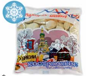
*ПЕЛЬМЕНИ "КОСТРОМСКИЕ", со свиной, Адмирал Бенбой, 400г