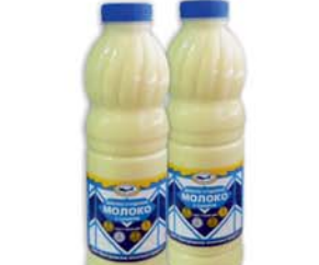
*МОЛОКО СГУЩЕННОЕ, цельн., с сахаром, пл/б, 1000г 8990 руб. 11290 руб.