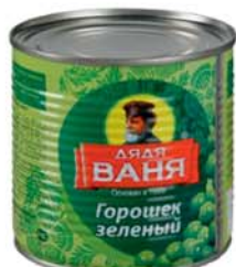
*ГОРОШЕК ЗЕЛЕНЫЙ "ДЯДЯ ВАНЯ", ж/б, 400г 2590 руб. 4090 руб.