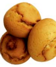
ПЕЧЕНЬЕ "ТВОРОЖНОЕ", с начинкой, в ассорт., Сладкий рай, 1кг 9990 руб. 15290 руб.