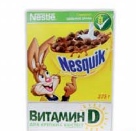
ГОТОВЫЙ ЗАВТРАК "НЕСВИК", 375г