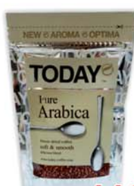
КОФЕ "ТУДЭЙ", "Арабика", м/уп, 75г 11990 руб. 17090 руб.