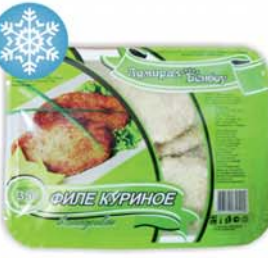
ФИЛЕ КУРИНОЕ В ПАНИРОВКЕ, Адмирал Бенбой, 350г