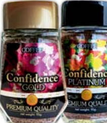
*КОФЕ "CONFIDENCE", "Gold"; "Platinum", натур., раствор., сублимир., ст/б, 95г 12990 руб. 17990 руб.