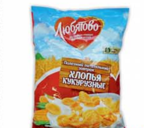
*ХЛОПЬЯ КУКУРУЗНЫЕ, с сахаром, классич., 370г