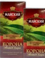
ЧАЙ "МАЙСКИЙ", "Корона Российской Империи", черн., лист., 25пак*2г 3790 руб. 4670 руб.