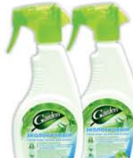
*СРЕДСТВО ДЛЯ КУХНИ "ГАРДЕН", экологичный, спрей, 500мл 6990 руб. 8270 руб.