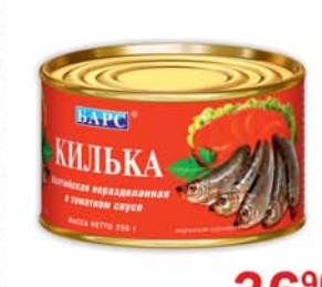
КИЛЬКА "БАРС", в томатном соусе, ж/б, 250г