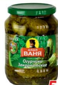
*ОГУРЦЫ "ДЯДЯ ВАНЯ", закарпатские, ст/б, 680г 5490 руб. 8990 руб.