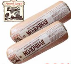
*КОЛБАСА "МОЛОЧНАЯ", 1с, Мясной двор, 1кг