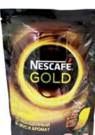
КОФЕ "НЕСКАФЕ", "Голд", м/уп, 150г 21990 руб. 32890 руб.