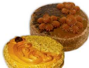
ТОРТ "ГАММИ"; "ТОМА" Парус, 800г 13790 руб. 18790 руб.