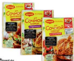
*СМЕСЬ "МАГГИ" НА ВТОРОЕ, для кур. с чесноч., 38г; для кур. с паприкой, 34г; для соч. цыпленка табака, 47г 3590 руб. 5170 руб.