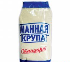
*КРУПА МАННАЯ "СТАНДАРТ", 800г