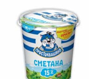
СМЕТАНА "ПРОСТОКВАШИНО", ж.15%, 350г