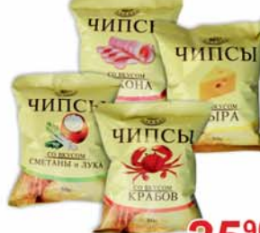
ЧИПСЫ "ВЫСШАЯ ЛИГА", в асорт., 80г