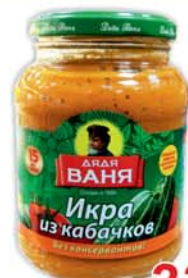
ИКРА "ДЯДЯ ВАНЯ", из обжар. кабачков, ст/б, 460г 3390 руб. 6670 руб.