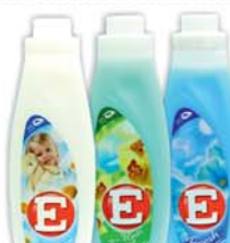
*КОНДИЦИОНЕР ДЛЯ БЕЛЬЯ "Е", фреш; сенсигв; тропический лес, 1л 7990 руб. 10390 руб.

Изображения товаров могут незначительно отличаться от представленных в магазинах. Количество товара ограничено. * - Товар представлен не во всех торговых точках сети "Высшая лига". Цены на товары указаны в рублях. В течение срока проведения акции цена может быть дополнительно снижена относительно заявленной в рекламе. Акция действительна с 13 по 22 марта 2015г. в г. Костроме, Костромской области, г. Ярославле и Ярославской области.