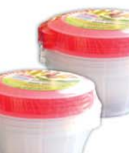
*НАБОР КОНТЕЙНЕРОВ, 4шт, d=12см 5990 руб. 7790 руб.