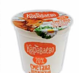
*СМЕТАНА "КАРАВАЕВО", ж.20%, 330г