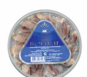
ПРЕСЕРВЫ "СЕЛЬДЬ", в масле, Буй, 170г