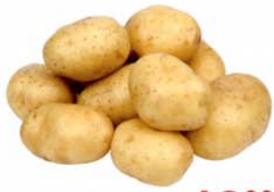
КАРТОФЕЛЬ, Россия, 1кг