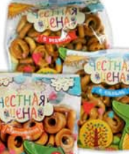
*СУШКИ "ЧЕСТНАЯ ЦЕНА", мини, в ассорт., 200г 1790 руб. 2290 руб.