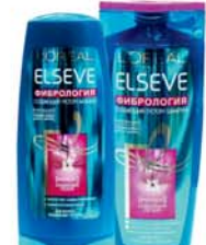
*ШАМПУНЬ "ЭЛЬСЕВ" "ФИБРОЛОГИЯ", 250мл; Бальзам-ополаскиватель "Эльсев", "Фибрология", 200мл 11990 руб. 16170 руб.