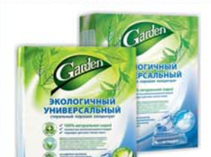
*СТИРАЛЬНЫЙ ПОРОШОК "ГАРДЕН", эколог., цитрус; без одушки, 400г 5990 руб. 7590 руб.