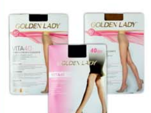
*КОЛГОТКИ "GOLDEN LADY", "Vita 40", 40 den, nero, daino, p.2, 3, 4, 5 9900 руб. 14590 руб.