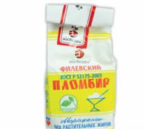
МОРОЖЕНОЕ "АЙСБЕРИ", пломбир, 450г