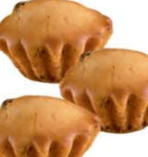
КЕКС "ЧАЙНЫЙ", Парус, 1кг 11990 руб. 15990 руб.