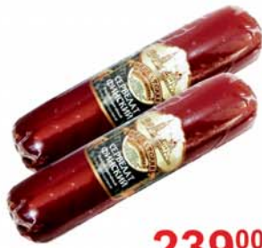
СЕРВЕЛАТ "ФИНСКИЙ", в/к, Знатные колбасы, 1кг