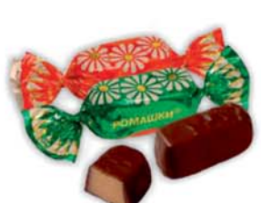
*КОНФЕТЫ "РОМАШКИ", Рот Фронт, 1кг 18990 руб. 26990 руб.