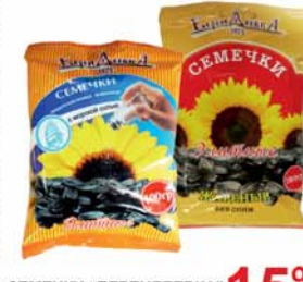
СЕМЕЧКИ "БЕРЕДДЕВКА", "Элитные", жареные, с морской солью; без соли, 100г