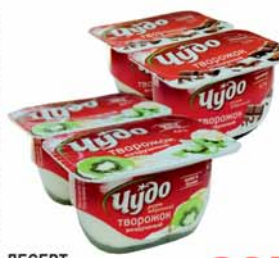
ДЕСЕРТ МОЛОЧНЫЙ "ЧУДО", с творожным кремом, в асорт., 100г