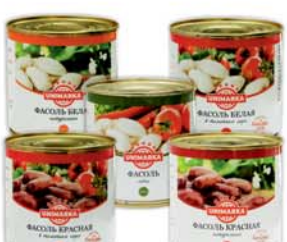
*ФАСОЛЬ "ЮНИМАРКА", в ассорт., ж/б, 400г 2690 руб.