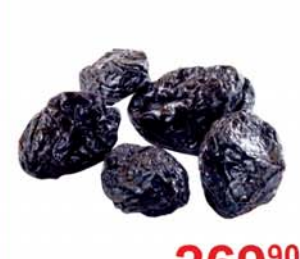
ЧЕРНОСЛИВ с косточкой, 1кг