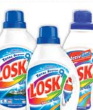
*ТЕЛЬ Д/СТИРКИ "ЛОСК", колор; горное озеро, 1.46л 19990 руб. 35990 руб.