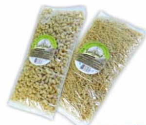
МАКАРОННЫЕ ИЗДЕЛИЯ "БЕРЕДДЕВКА", в/с, 800г