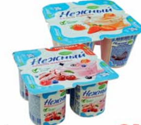
*ЙОГУРТОВЫЙ ПРОДУКТ "НЕЖНЫЙ", ж.1.2%, в асорт., 100г