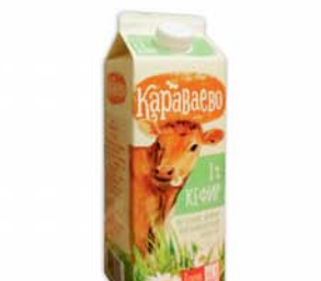
*КЕФИР "КАРАВАЕВО", ж.1%, 0,93л