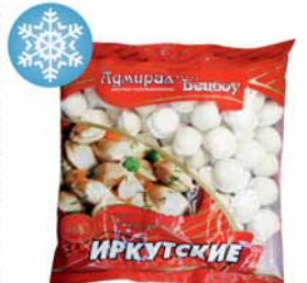
ПЕЛЬМЕНИ "ИРКУТСКИЕ", Адмирал Бенбой, 400г