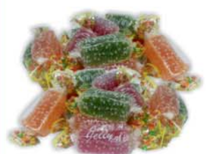
*КОНФЕТЫ "ДЖЕПЛИ МИКС", Меренга, 1кг 12550 руб. 17670 руб.