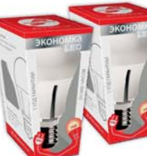
*ЛАМПА "ЭКОНОМКА" СВЕТОДИОДНАЯ, LED, 10Вт, E27, теплый свет, Китай 18990 руб. 27790 руб.