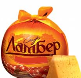
*СЫР "ЛАМБЕР", ж.50%, Алтайский край, 1кг