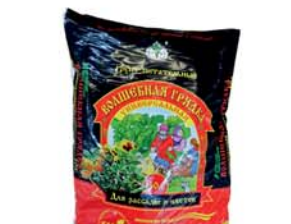
*ГРУНТ "ВОЛШЕБНАЯ ГРЯДКА", 10л 4900 руб. 6690 руб.