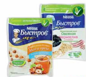
*КАША Б/П "БЫСТРОВ", овсяная с черносливом; 5 зл. с медом и орехом, 40г