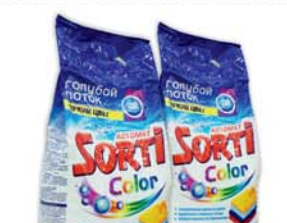
*СТИРАЛЬНЫЙ ПОРОШОК "СОРТИ", автомат, колор, 3кг 19990 руб. 29490 руб.