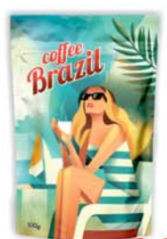
*КОФЕ "BRAZIL", натуральный, раствор., субл., м/уп, 100г 9990 руб. 13990 руб.