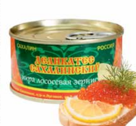
*ИКРА "ДЕЛИКАТЕС САХАЛИНСКИЙ", посолевая, ГОСТ, ж/б, 130г