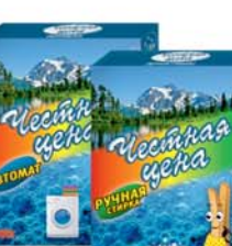
ПОРОШОК СТИРАЛЬНЫЙ "ЧЕСТНАЯ ЦЕНА", автомат; ручная стирка, 400г 2590 руб. 3190 руб.