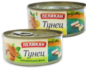
*ТУНЕЦ "ПЕЛИКАН" филе, натур.; в масле, Селеста, ж/б, 140г 53 90 руб. 66 90 руб.