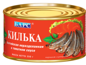
КИЛЬКА "БАРС" неразд., в т/с, ж/б, 250г 39 90 руб. 45 90 руб.