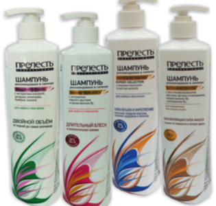
*ШАМПУНЬ "ПРЕЛЕСТЬ PROFESSIONAL" в ассорт., 600мл 129 90 руб. 159 90 руб.