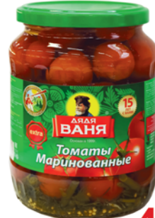
*ТОМАТЫ "ДЯДЯ ВАНЯ" маринованные, ст/б, 680г 49 90 руб. 81 90 руб.