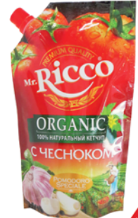
*КЕТЧУП "MR. RICCO" с чесноком, 350г 49 90 руб. 68 90 руб.