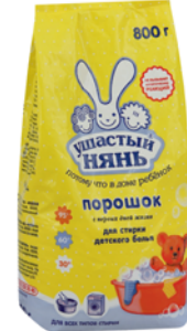
*СТИРАЛЬНЫЙ ПОРОШОК "УШАСТЫЙ НЯНЬ" детский, 800г 79 90 руб. 105 90 руб.