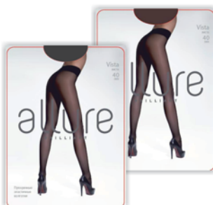
*КОЛГОТКИ "ALLURE" "Vista", 40den, glase; nero, p.2,3,4,5 93 90 руб. 126 90 руб.