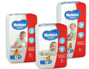
*ПОДГУЗНИКИ "HUGGIES" "ЧЕСТНАЯ ЦЕНА" Classic, №3 (4-9кг, 16шт); №4 (7-18кг, 14шт); №5 (11-22кг, 11шт) 179 90 руб. 215 90 руб.