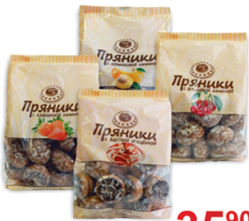
ПРЯНИКИ "ВЫСШАЯ ЛИГА" завар. с начинкой, в ассорт., 350г 35 90 руб. 42 90 руб.