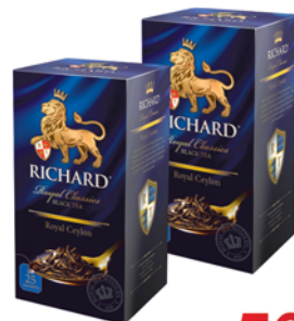
*ЧАЙ "RICHARD" "Royal Ceylon", 25пак*2г 59 90 руб. 84 90 руб.