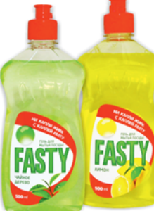
*СРЕДСТВО ДЛЯ ПОСУДЫ "FASTY" Чайное дерево; Лимон, 500мл 39 90 руб. 53 90 руб.