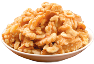
ГРЕЦКИЙ ОРЕХ очищенный, 1кг 549 90 руб.