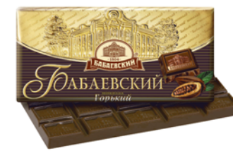
ШОКОЛАД "БАБАЕВСКИЙ" горький, 100г 65 50 руб. 92 50 руб.