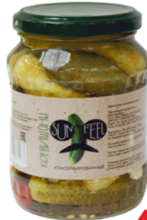
*ОГУРЦЫ "SUNFEEL" корнишоны, ст/б, 350г 49 90 руб. 65 90 руб.