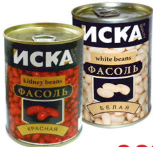
ФАСОЛЬ "ИСКА" красная; белая, ж/б, 425г 33 90 руб. 42 90 руб.