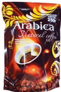
КОФЕ "ARABICA" натур., раствор., м/п, 250г 289 90 руб.