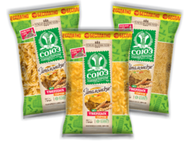
*МАКАРОННЫЕ ИЗДЕЛИЯ "СОЮЗПИЩЕПРОМ" спагетти, 500г; в ассорт., 450г 21 90 руб. 30 90 руб.