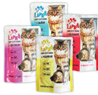
КОРМ ДЛЯ КОШЕК "ЛАРКА" говядина, 85г; индейка; кролик; рыба, м/п, 100г 13 90 руб.