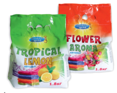
*ПОРОШОК СТИРАЛЬНЫЙ "ЧЕСТНАЯ ЦЕНА" "Tropical lemon"; "Flower aroma", автомат, 1.8кг 89 90 руб. 108 90 руб.

Изображения товаров могут незначительно отличаться от представленных в магазинах. Количество товара ограничено. Цены на товары указаны в рублях. В течение срока проведения акции цена может быть дополнительно снижена относительно заявленной в рекламе. Акция действительна с 1 по 10 апреля 2016г. в г.Костроме, Костромской области, г.Ярославле и Ярославской области. *Товар представлен не во всех торговых точках.