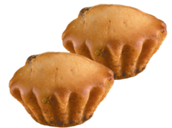
КЕКС "ЧАЙНЫЙ" Парус, 1кг 139 90 руб. 179 90 руб.