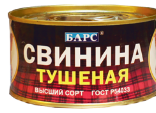
*СВИНИНА ТУШЕНАЯ "БАРС" ГОСТ, ж/б, 325г 109 90 руб. 144 90 руб.