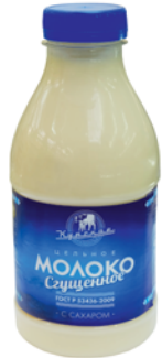
МОЛОКО СГУЩЕННОЕ "КУРСКОЕ РАЗДОЛЬЕ" цельн. с сахаром, 720г 69 90 руб. 88 90 руб.