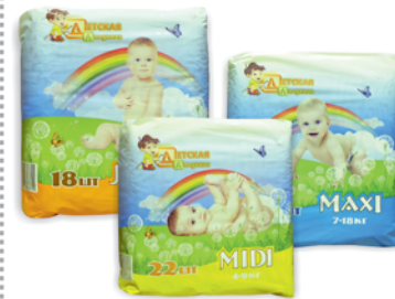
*ПОДГУЗНИКИ "ДЕТСКАЯ АКАДЕМИЯ" Junior, 11-25кг, 18шт; Maxi, 7-18кг, 20шт; Midi, 4-9кг, 22шт 239 90 руб. 293 90 руб.