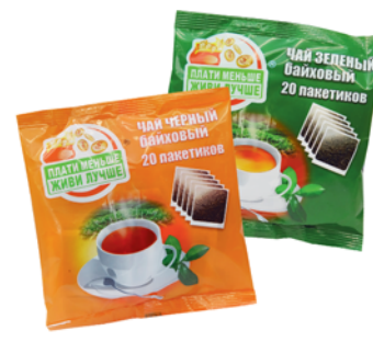
ЧАЙ "ПЛАТИ МЕНЬШЕ ЖИВИ ЛУЧШЕ" черный; зеленый, 20пак*1.5г 16 90 руб.