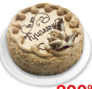
ТОРТ "КРЫМСКИЙ" Парус, 800г 299 90 руб. 438 90 руб.