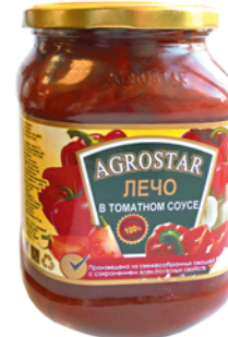
*ЛЕЧО "AGROSTAR" в т/с, 720г 49 90 руб.