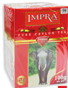
*ЧАЙ "IMPRA" черный, круп. лист., 100г 75 90 руб. 86 90 руб.