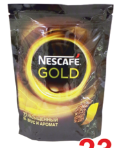
КОФЕ "NESCAFE" "Gold", м/п, 150г 239 90 руб. 374 90 руб.