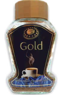
КОФЕ "ВЫСШАЯ ЛИГА" "Gold", натур., раствор., сублим., ст/б, 95г 143 90 руб.