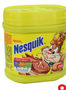
КАКАО "NESQUIK" пл/п, 250г 89 90 руб. 117 90 руб.