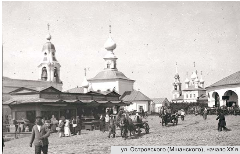
ул. Островского (Мшанского), начало XX в.

Улица Островского — древнейшая в городе. Здесь, на перекрестке с улицей Пятницкой, находился исторический центр Костромы с кремлем, который позже перенесли в другое место. Нынешнее название улица получила в 1948 году в связи со 125-летием со дня рождения Александра Николаевича Островского.