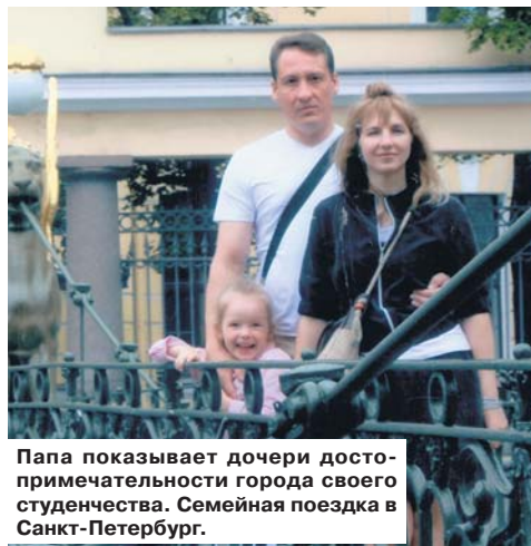
Папа показывает дочери достопримечательности города своего студенчества. Семейная поездка в Санкт-Петербург.