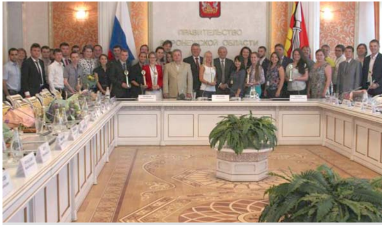
Награждение лауреатов конкурса «Новые лица» в Воронеже

Несмотря на летние каникулы, костромская молодежь активно принимает участие в различных проектах, конкурсах и фестивалях всероссийского и даже международного уровня. Талантливые школьники и студенты достойно представляют наш край на творческой и профессиональной арене, достигая высоких результатов.