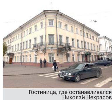
Гостиница, где останавливался Николай Некрасов