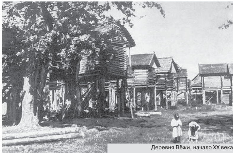
Деревня Вёжи, начало XX века

Комплексная застройка улицы Некрасова началась со второй половины XX века. Левая, нечетная, сторона была заболочена и долго не застраивалась. Название улица получила в честь великого русского поэта Николая Алексеевича Некрасова, судьба и творчество которого тесно связаны с костромским краем.