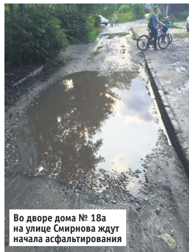
Во дворе дома № 18а на улице Смирнова ждут начала асфальтирования

ООО КБ «Конфидэнс Банк». Лицензия Банка России № 970.