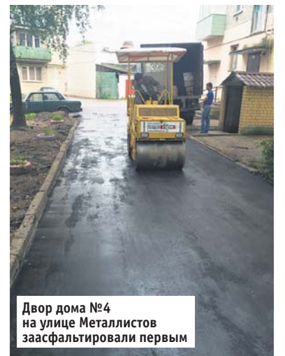
Двор дома № 4 на улице Metallistov заасфальтировали первым