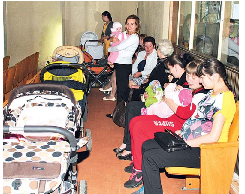
Чествование новорожденных в Нерехте

Средства материнского капитала перечисляются в безналичной форме на счет продавца. Срок перечисления денег – не более двух месяцев с даты обращения в территориальный орган Пенсионного фонда России.