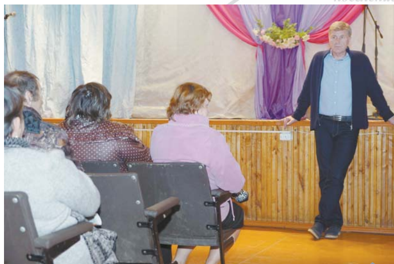
Извечная проблема - это дороги, но еще хуже, когда у людей нет возможности хотя бы по таким дорогам проехать. На отсутствие нормального автобусного маршрута жалуются жители села Сущево.