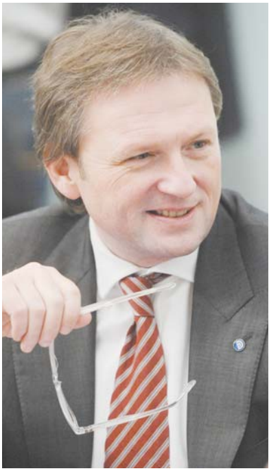
Борис ТИТОВ - лидер Партии Роста, Уполномоченный при Президенте РФ по защите прав предпринимателей, сопредседатель Общероссийской общественной организации «Деловая Россия».