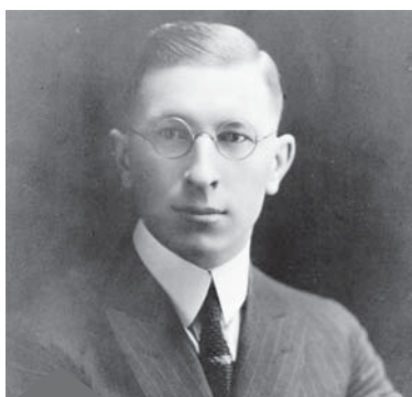
Фредерик Бантинг - один из открывателей гормона инсулина. Лауреат Нобелевской премии по физиологии и медицине в 1923 году.

Летом 1921 Бантинг вместе с коллегой Чарльзом Бестом получили из ткани железы вещество, первоначально названное «айлетин», - оно-то и оказалось тем самым средством от сахарного диабета, о котором врачи мечтали несколько веков подряд.