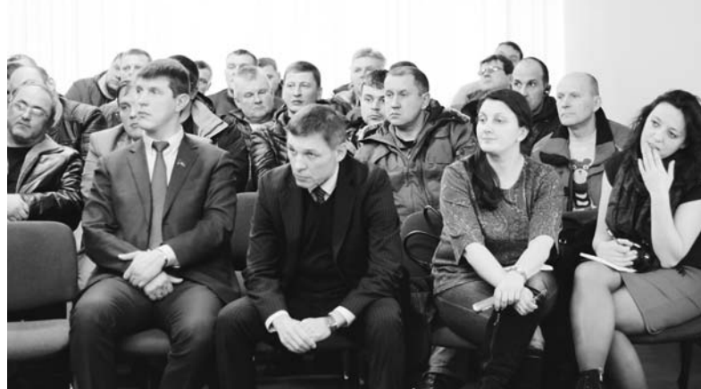
25 ноября перевозчики встретились с депутатами.

Тем временем на митинге прозвучало следующее: платный проезд для 12-тонников - это только начало. Начало перехода к платным дорогам для любого транспорта вообще. Костромские перевозчики призывают всех костромичей поддержать их сегодня в борьбе за отмену статьи 31.1 257-ФЗ - закона, который коснется всех.